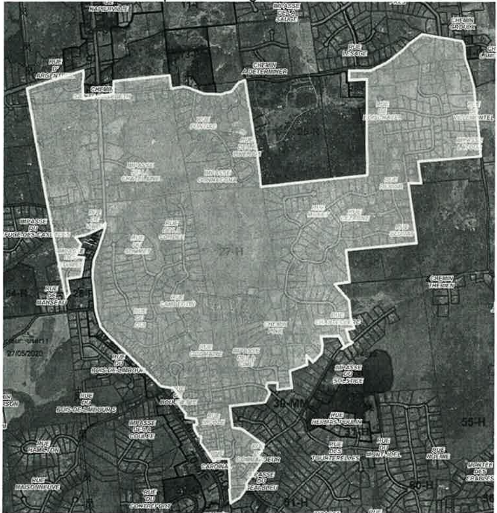
Extrait du plan de zonage après la modification